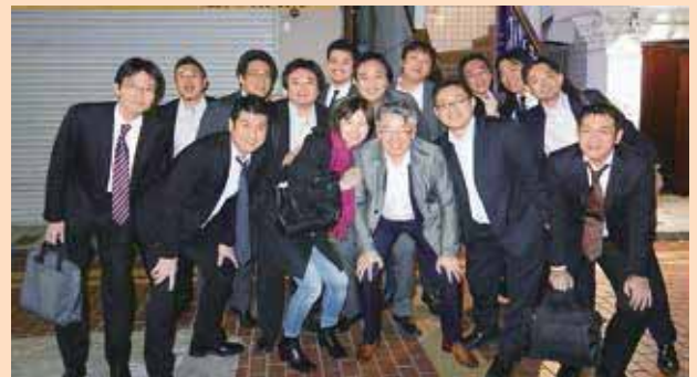
若手？大腸外科医の集いにて：左から 6 番目が筆者

さて、腹腔鏡下大腸手術に関して、当施設は四国内でも随一の症例数を有しておりますが、内視鏡外科手術の質の高さの指標として日本内視鏡外科学会の技術認定制度があります。この制度の総則の第一条（目的）が以下のように示されています。「各学会の定める専門医制度とは異なり、内視鏡手術に携わる医師の技術を高い基準にしたがって評価し、後進を指導するにたる所定の基準を満たした者を認定するもので、これにより本邦における内視鏡外科の健全な普及と進歩を促し、延いては国民の福祉に貢献することを目的とする。」大腸領域の合格率は 25%前後で狭き門となっておりますが、この内視鏡外科技術認定取得を目指し、また今後も質の高い医療を提供できるように日々研鑽を積んでいく所存です。