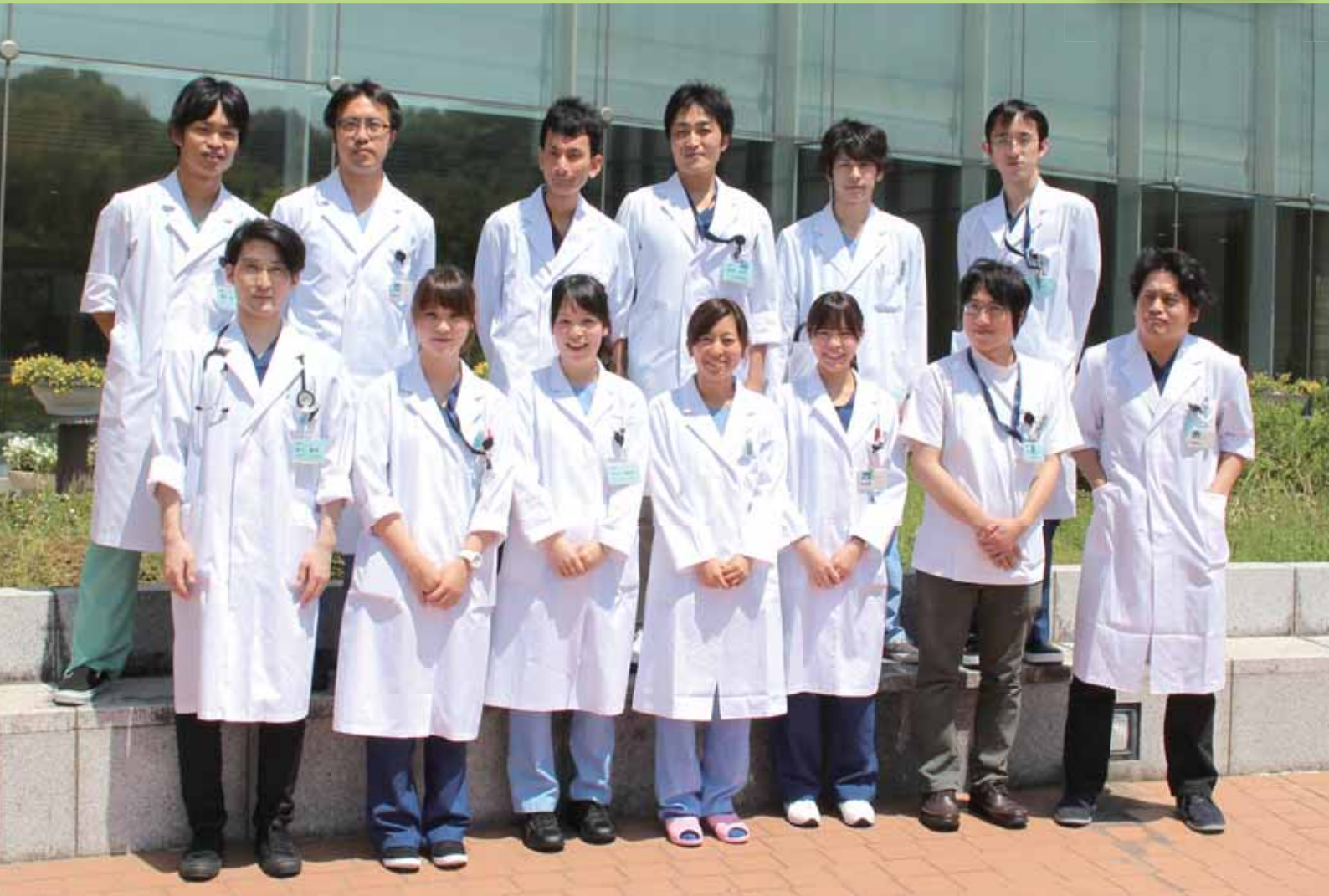
平成 27 年度初期臨床研修医です！ よろしくお願ひします！