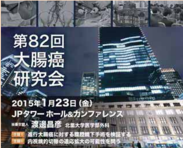
第 82 回 大腸癌研究会ポスター

平成 27 年 1 月 23 日、東京駅に隣接する JP タワーホール&カンファレンスで開催された、第 82 回大腸癌研究会に出席してきました。