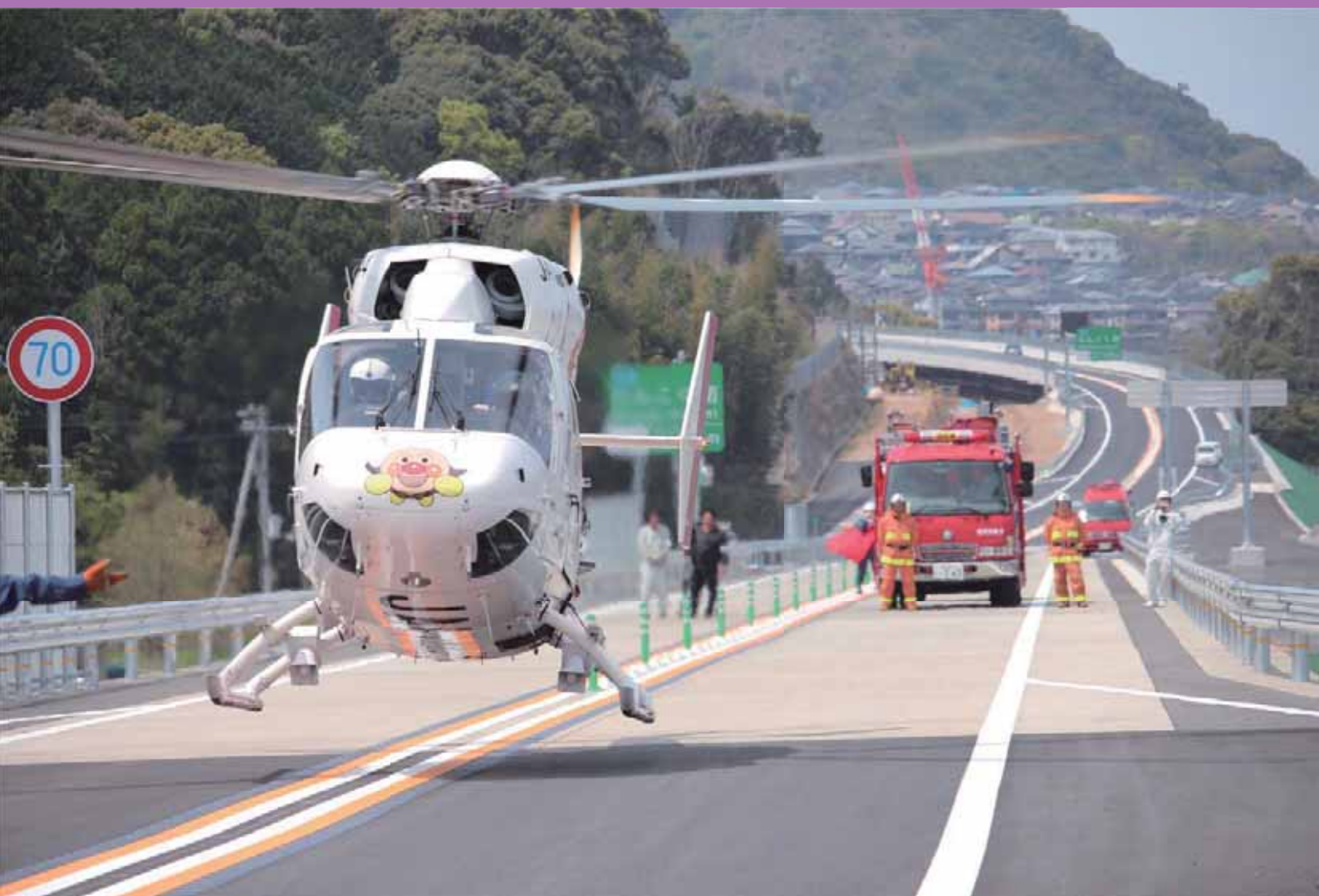
【四国初！】4月11日(月)高速道路で事故が起きた想定でドクターヘリが高速道路に着陸し、けが人を救急搬送する訓練が開通前の高知南国道路にて行われました。