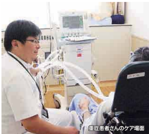
重症患者さんのケア場面

近年、高度医療、救命医療の発展により、集中治療領域では、看護職における専門家(Expert nurse)育成が必要だと考えられ、誕生したのが集中ケア認定看護師です。「集中ケア」とは、その用語のごとく、重症かつ集中治療を要する患者さん・ご家族への看護、いわゆる生命の危機的状態にある人間の反応に対処する看護という意味です。