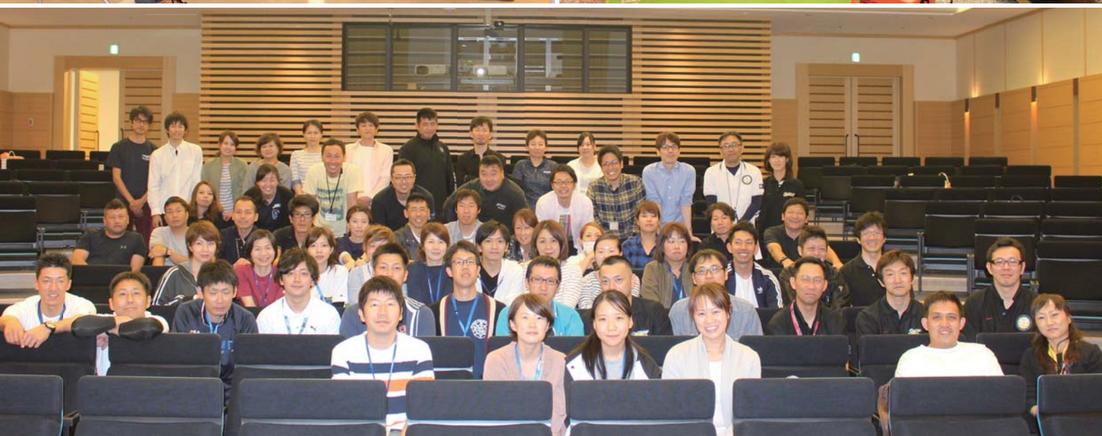
5月13 ~ 14日開催されたJPTECに参加されたみなさん