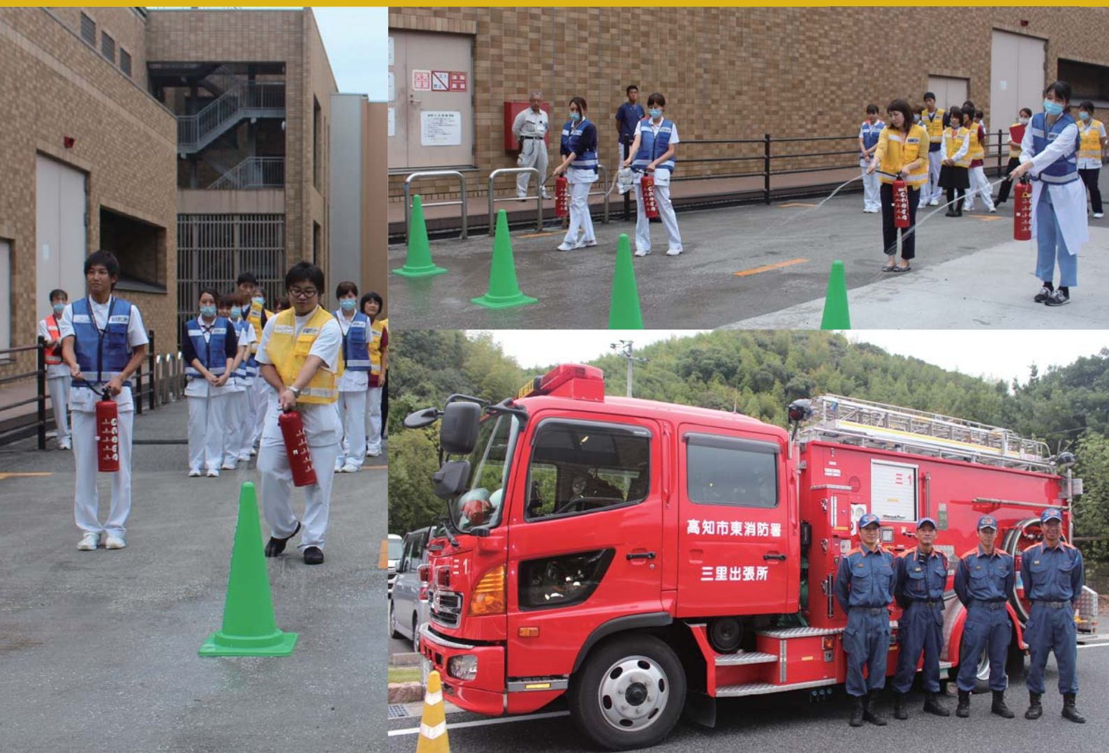
10月5日(木) 高知市東消防署 三里出張所 消防隊のみなさんのご協力の下、消防訓練が行われました。