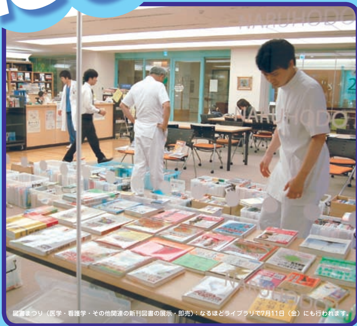
図書まつり（医学・看護学・その他関連の新刊圖書の展示・即売）：なるほどライブラリで7月11日（金）にも行われます。