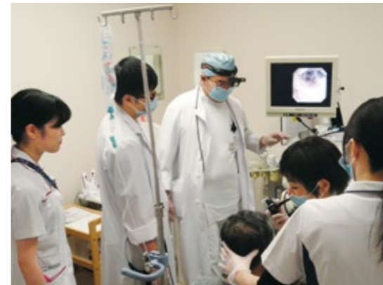
多職種協働の治療場面