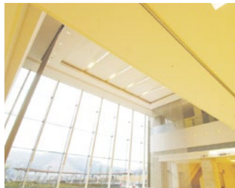
▼光あふれるふれあいロビー