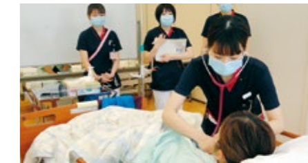
シミュレーション研修では、フィジカルアセスメント技術を活用し、複数患者の観察やアセスメントについて学んでいます。