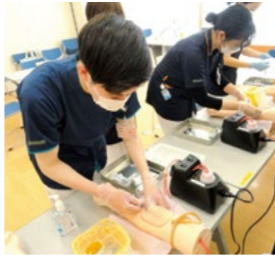
安全で確かな技術習得のため、シミュレーターを活用し、筋肉注射や採血などの演習を行います。