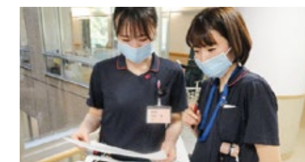
新人看護師1人に対して2人の実地指導者が担当しています。写真は患者さんの指示簿と一緒に確認している様子です。