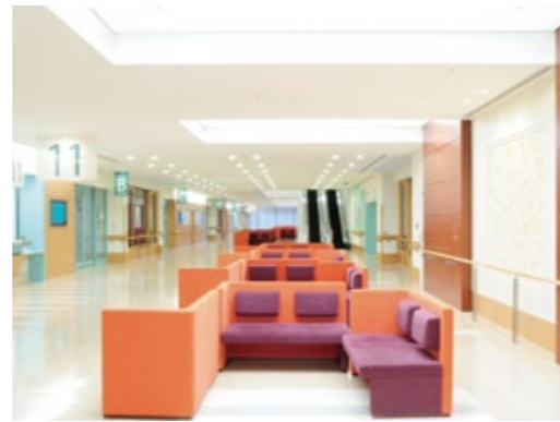
▲ゆったりした待合空間