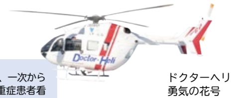
ドクターヘリ 勇気の花号

救急車による来院患者数 4,555人/年 ドクターヘリ搬送件数 255件/年 FMRC出動件数 122件/年 (2022年度データ)