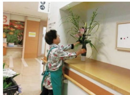
年間を通して、ボランティアの方に大切に育てられた花々が来院者の心を和ませてくれています。