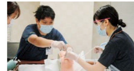
日常生活援助の技術習得にむけて、4～5月に口腔ケアやスキんケア、コンチネンス、食事介助、吸引など様々な研修を行います。写真は吸引の研修の様子です。