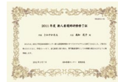
新人看護師研修修了証