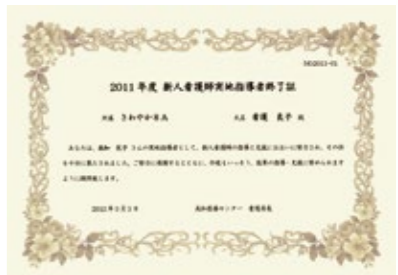
実地指導者終了証