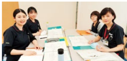
部署配属前に、配属部署の責任者や指導者から、部署の看護の特徴等を学び、交流をもつことで、職場適応の促進につながっています。

研修の講師は、副科長や実地指導者リーダー、専門看護師や認定看護師等が担っています。