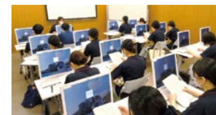
電子カルテ操作研修