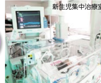
新生児集中治療室

小さく生まれた赤ちゃんや障害のある赤ちゃんに対しては、地域の訪問看護師や保健師と連携し、子どもと家族を支えるケアを実践しています。