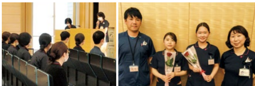
歓迎会では部署責任者や副科長が参加し、配属部署をお伝えしています。

・新型コロナ感染拡大に伴い、マスクを着用し、間隔を十分設けて研修を行っております。