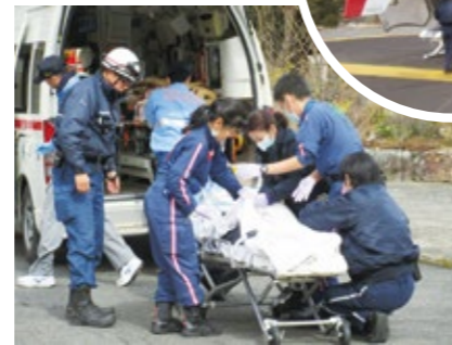
急性・重症患者看護専門看護師