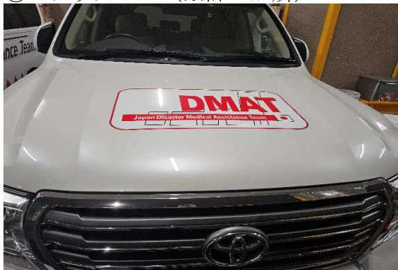
⑦ステッカー1 (※計3か所)