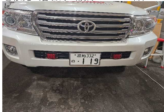
⑥散光式警告灯 (前方バンパー部)