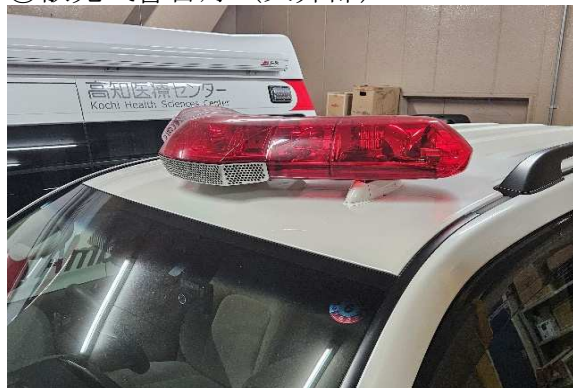
⑤散光式警告灯 (天井部)